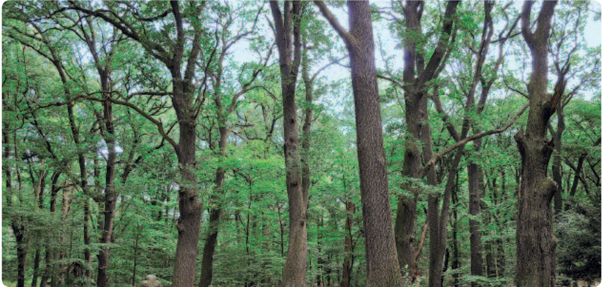
Eichenwald im Glienicker Park