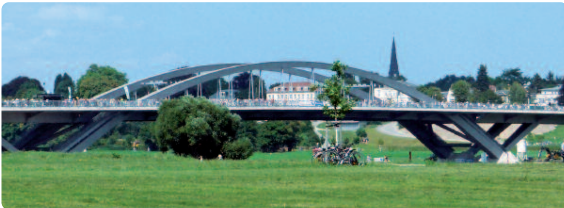
Waldschlösschenbrücke in Dresden

derungen bewahrt werden. Hier würde sich eine potenzielle Veränderung der Natura-2000-Richtlinien besonders negativ auswirken, da Landschaftsschutz und bestehende Schutzgebiete entweder auf der FFH-Richtlinie beruhen oder zu kleinräumig sind, um einen dauerhaften Erhalt der wertgebenden Bausteine der zukünftigen Welterbestätte sicherzustellen.